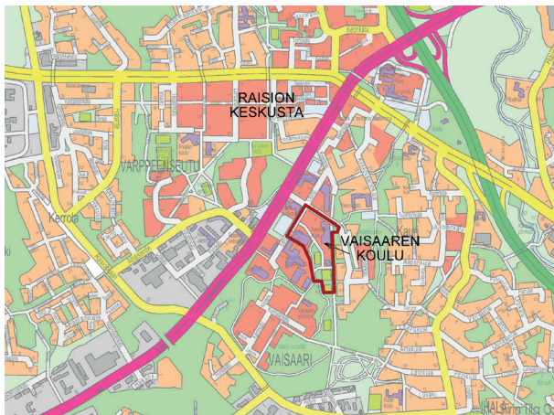
Liite 1: Alueen sijainti

Suunnittelualue sijaitsee Raision 1. kaupunginosassa (Vaisaari) Eeronkujan, Juhaninkujan ja Alakoululaisenankkeen välisellä alueella. Alue sijaitsee Raision torilta n. 0,6 km etelään. Alueen koko on noin 5,0 ha.