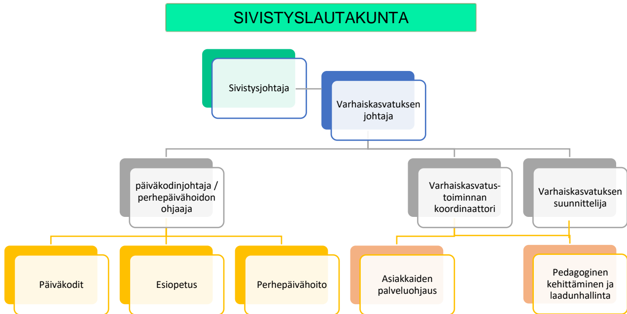
Kuvio 2: Raision varhaiskasvatuksen johtamisen rakenne.

Vuonna 2021 Raision kaupungin varhaiskasvatukseen kuuluu neljätoista yksikköä, joista kymmenessä järjestetään myös esiopetusta. Erillisiä esiopetusyksiköitä Raisiossa on kolme. Ryhmäperhepäiväkoteja kaupungissa on kuusi ja niistä kaksi toimii vararyhmäperhepäiväkoteina. Kunnallisia perhepäivähoitajia Raisiossa toimii noin kaksikymmentä. Avointa varhaiskasvatusta Raisiossa annetaan seurakunnan ja varhaiskasvatuksen yhteisenä puistotoimintana. Yksityisiä päiväkoteja Raisiossa on kolme; kaksi suomenkielistä ja yksi ruotsinkielinen. Raisiossa toimii myös yksityisiä perhepäivähoitajia.