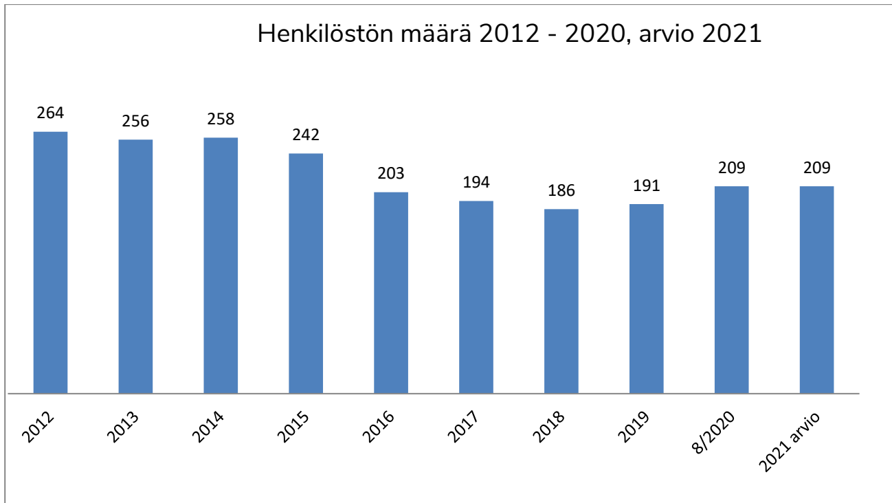
Taulukko 5 Henkilöstön määrä

Henkilöstömäärässä näkyvä nousu vuodesta 2019 selittyy sillä, että määräaikaiset palvelussuhteet päättyivät vuonna 2019 ennen 31.12. Toimintakertomuksessa 2019 todetaan, että vuoden aikana opettajia on ollut 12 enemmän kuin 31.12. tilanteessa.