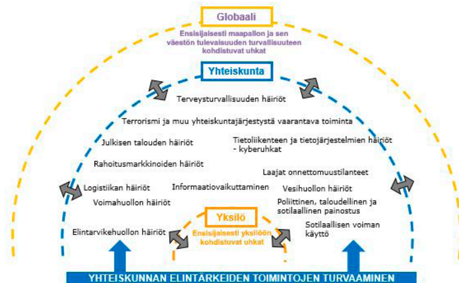
Kuva 2. Uhkamallit 2018

Uhkien tunnistaminen ja niiden vaikuttavuuden arviointi on osoittautunut haasteelliseksi. Toimintaympäristön muutosten seuranta ja analysointi sekä ennakointivalmiuksien ylläpitäminen tuleekin olla kaikkien yhteiskunnan varautumisesta ja häiriötilanteiden hallinnasta vastuussa olevien tahojen jatkuvaa ja aktiivista toimintaa.