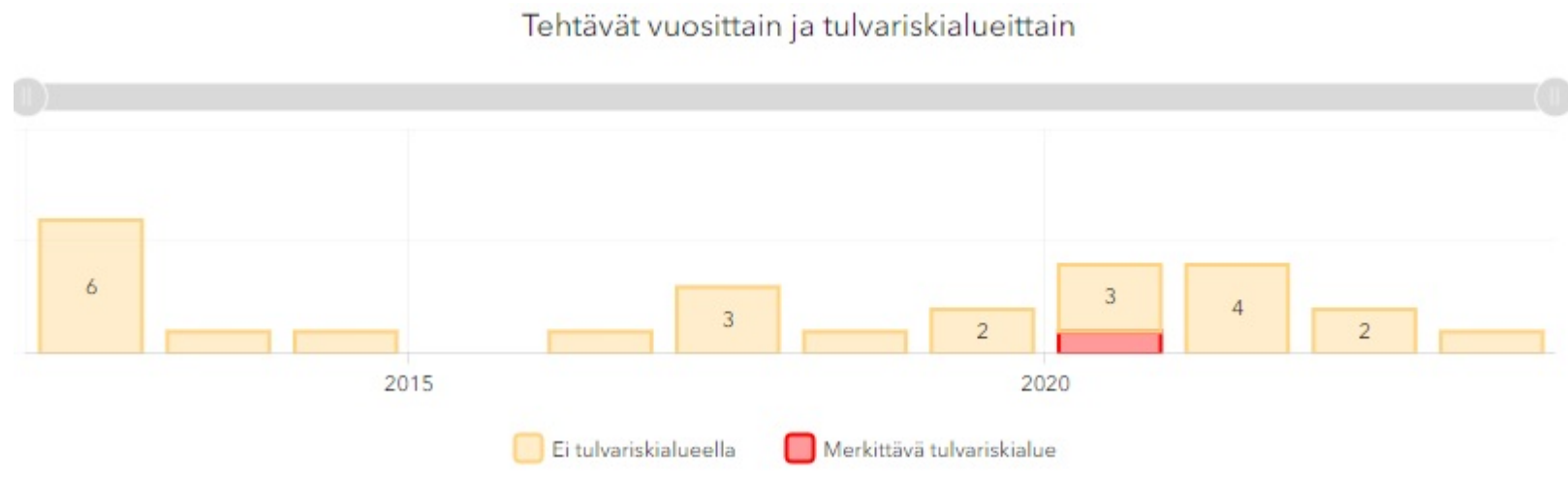
Kuva 1. Pelastuslaitoksen PRONTO-ohjelmaan kirjatut huleveteen liittyvät vahingontorjuntatehtävät Raisiossa vuosittain

Tietoa Raision alueella tapahtuneista hulevesitulvista on kerätty Pelastustoimen onnettomuus- ja resurssitilasto PRONTO:sta aikaväliltä 1.1.2011 - 31.12.2023 (vuoden 2023 tiedot päivitetty 17.4.2024). Pelastuslaitoksen PRONTO-tietokannasta löytyi 25 huleveteen liittyvää vahingontorjuntatehtävää ei tulvariskialueella . Vuodelta 2020 oli yksi merkintä päivystystapauksessa alueella, joka kuuluu Turun rannikkoalueen tulvariskialueeseen.