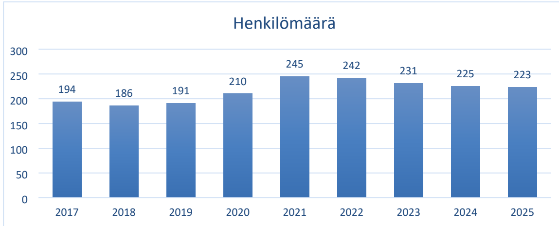
Taulukko 5. Henkilömäärä

Yhteiset palvelut: talous- ja henkilöstöhallinto, kiinteistöpalvelut, ruokapalvelut, ICT-palvelut, opintopalvelut eli opiskelijahallinto. Lisäksi organisaatioon kuuluvat markkinointi sekä hanke- ja kehittämispalvelut.