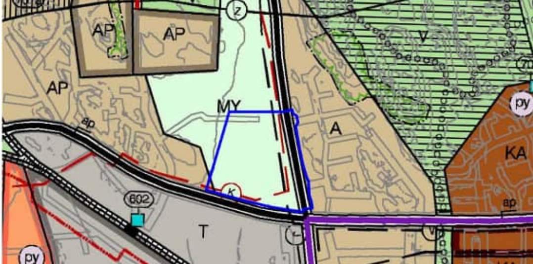
Ote voimassa olevasta yleiskaavasta

Suunnittelualueella on voimassa Raision yleiskaava, joka on hyväksytty vuonna 2004. Yleiskaavassa alue on maa- ja metsätalousvaltaista aluetta, jolla on erityisiä ympäristöarvoja (MY). Alueelle saa rakentaa vain maa- ja metsätaloutta palvelevia rakennuksia häiritsemättä ympäristöarvojen säilymistä. Alueen itä- ja eteläreunassa on aluevaraus maanlaiselle jätevesilinjalle ja eteläreunassa on lisäksi varaus kaukolämmölle.