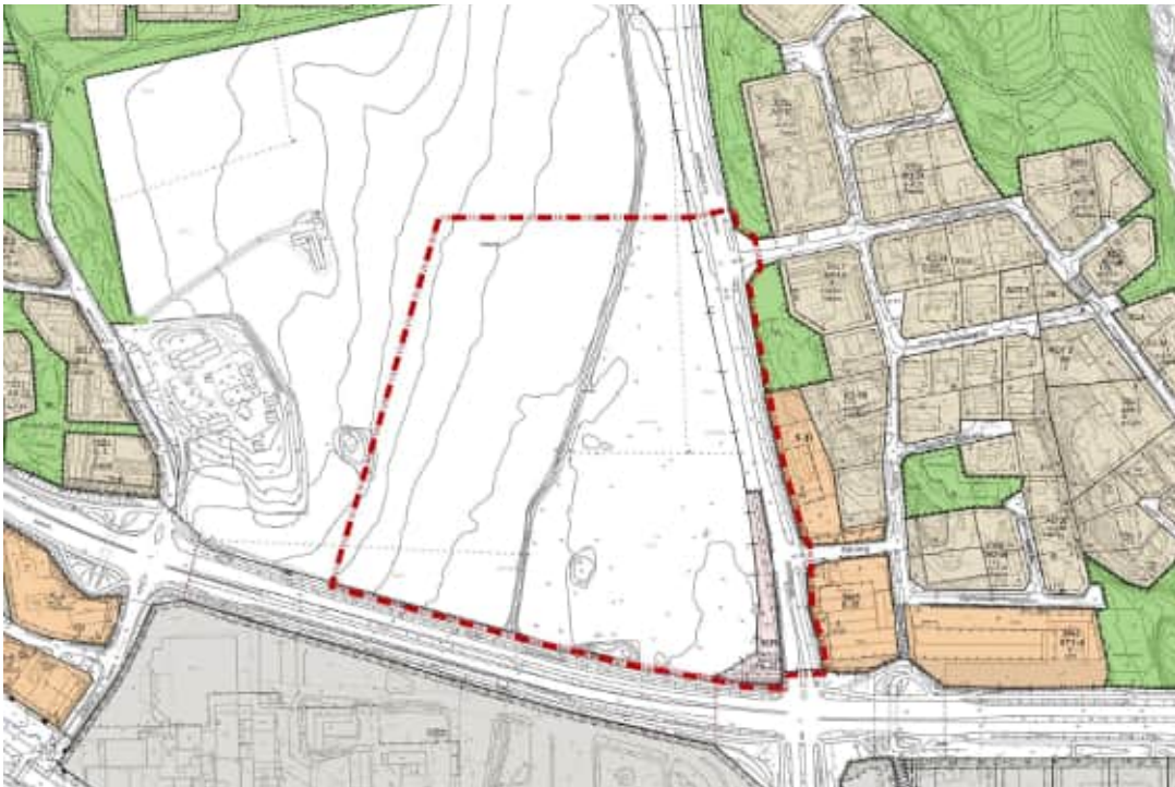
Ote voimassa olevasta asemakaavasta

Muu osa alueesta on asemakaavoittamatonta.