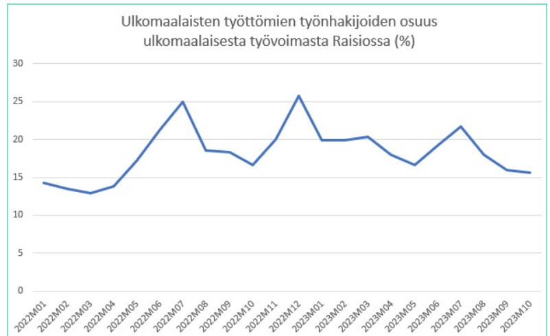
Raisio: Ulkomaalaisten työttömien työnhakijoiden osuus ulkomaalaisesta työvoimasta (%) kk:n lopussa tammikuu 2022-lokakuu 2023

Ulkomaalaisten työnhakijoiden aktivointiaste on Raisiossa varsin korkea. Aktivointitoimenpiteistä määrällisesti suurimmat ovat työvoimakoulutus ja omaehtoinen opiskelu, mutta ulkomaalaisia työnhakijoita on myös palkkatuella työllistettynä, kuntouttavassa työtoiminnassa sekä työkokeiluissa.