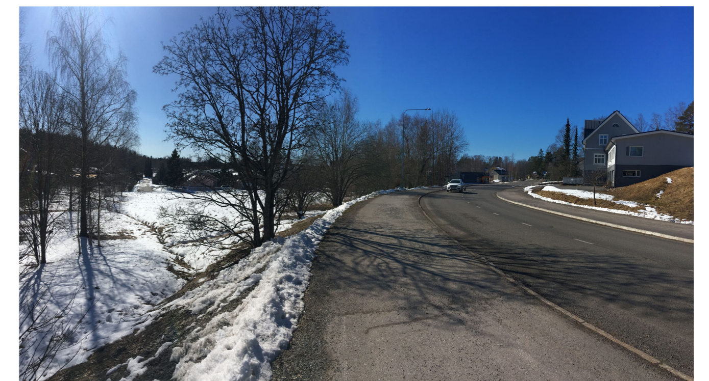
NÄKYMÄ IHALANTIelta (nykytilanne)