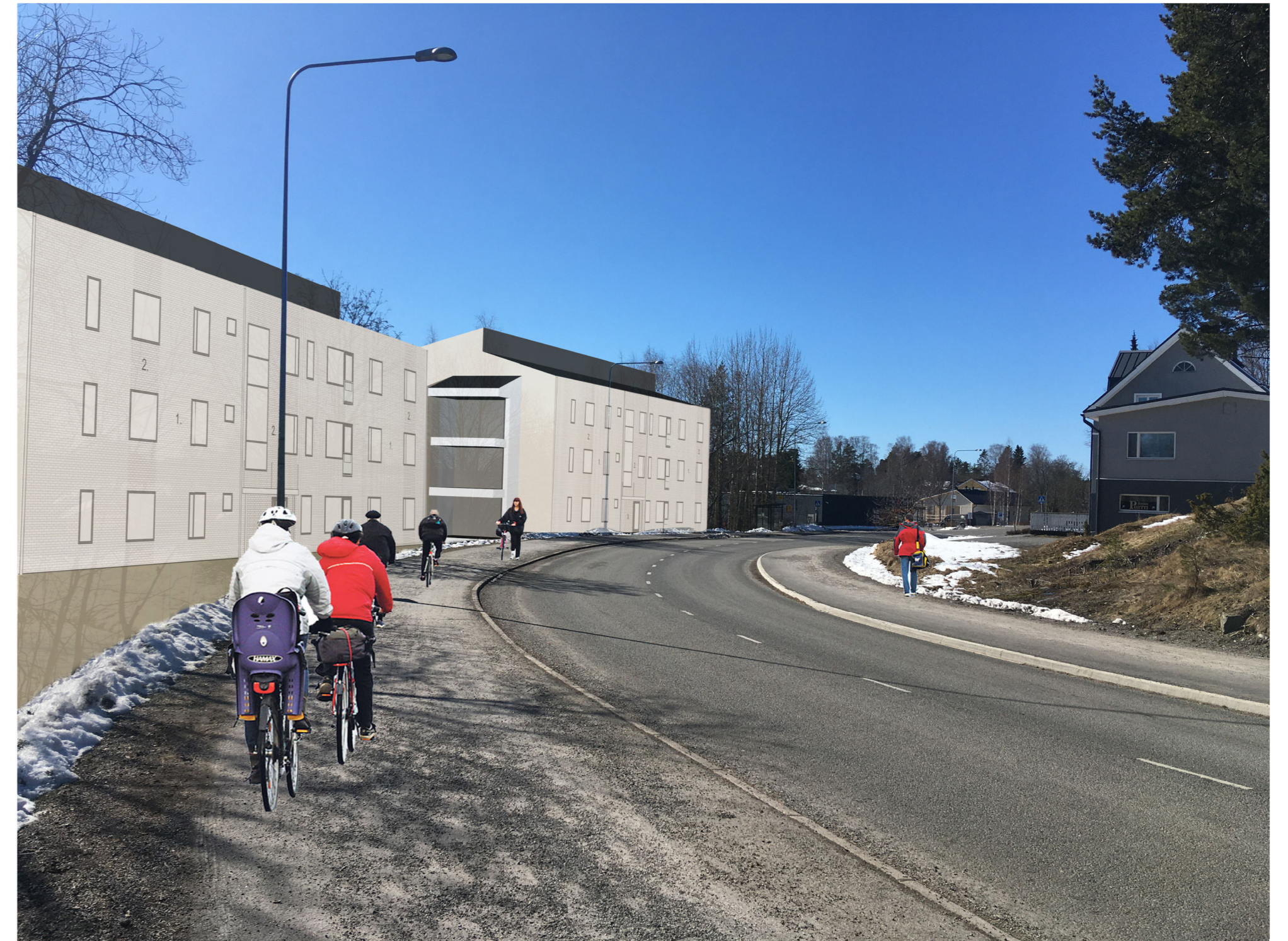
NÄKYMÄ IHALANTIelta (suunnitelma)

Asemakaavamuutoksessa pääkäyttötarkoitus säily ennallaan eli asuinrakennusten korttelialueena (A). Autopaikkojen korttelialue (LPA) liitetään osaksi tonttia, ja siihen sijoitetaan korttelin autopaikat. Rakentamisedellytyksiä parannetaan kaavamääräysten muutoksilla. Rakennusalan rajoja väljennetään. Suurin sallittu kerrosluku korotetaan kolmesta neljään. Rakennusoikeus on 3800 k-m 2 (=10 % lisäys). Lisäksi sallitaan autosuojien rakentaminen. Alueelle on tarkoitus rakentaa kaksi uutta asuinkerrostaloa. Asuinrakennukset sijoitetaan Ihalantien varteen. Tarkemmat kaavamääräykset suunnitellaan kaavaehdotuksen yhteydessä.