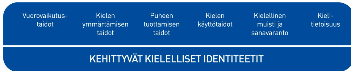
Kuvio 2. Lasten kielen kehityksen keskeiset osa-alueet varhaiskasvatuksessa

Kielen oppimisen kannalta on tärkeää tiedostaa, että saman ikäiset lapset voivat olla eri vaiheissa kielen kehityksen eri osa-alueilla. Kielelliset identiteetit kehittyvät , kun lapsia ohjataan ja tuetaan kielellisten taitojen ja valmiuksien keskeisillä osa-alueilla.