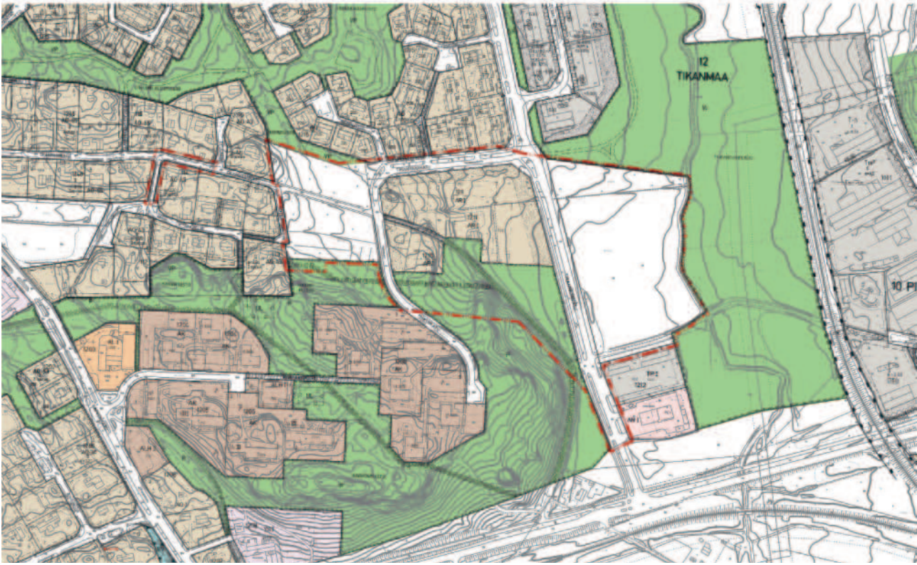
Ote voimassa olevasta asemakaavasta

Suunnittelualue on osin kaavoittamaton. Osalla aluetta on voimassa Hakinmäen asemakaava vuodelta 1974 (kaavatunnus 12:1). Muutettavassa asemakaavassa suunnittelualueelle sijoittuu kaksi rivitalojen ja muiden kytkettyjen rakennusten korttelialuetta. Asemakaava ei ole tältä osin toteutunut. Muutettavassa asemakaavassa on myös puistoaluetta, jolla risteilee ohjeellisia yleiselle jalankululle varattuja alueen osia.